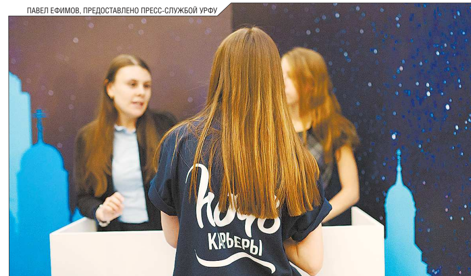
Ярмарки вакансий – отличная возможность лично пообщаться с работодателями

– В каждой команде должно быть несколько ролей. Рассмотрим на примере «Мстителей» Marvel. Это координатор, ко-