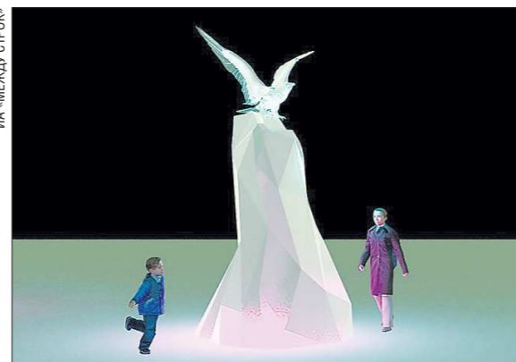
Городок в Нижнем Тагиле (слева) будет посвящён году Парящего Орла, городок в Екатеринбурге (справа) — сказам Бажова. На оба выделят весомые суммы из местных бюджетов

Отметим, что в третий перечень попали 24 муниципальных образования Свердловской области. В этом списке оказались не только Усть-Ишимский, Красноуральский и Сладковский сельские поселения, Махнёвское муниципальное образование, Слободино-Туринский муниципальный район, Гаринский и Тугульминский городские округа, но также и более внешне благополучные Каменский, Новоуральский, Мальшевский, Красноуральский городские округа.