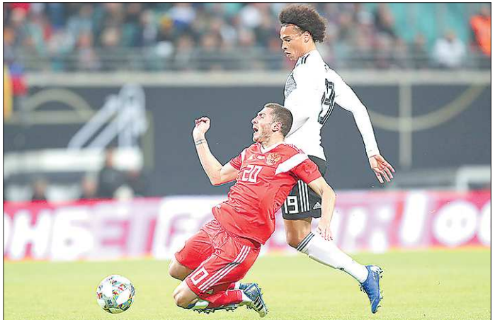
В первом тайме сборная России не могла ничего противопоставить сборной Германии

Сборная России по футболу провела очередной товарищеский матч. Соперником нашей команды была Германия, и встреча, проходившая в Лейпциге, закончилась разгромным поражением россиян — 0:3.