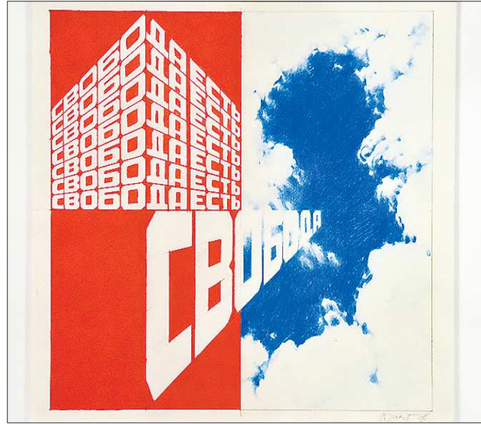
Эрик Булатов. «Свобода есть»

Выставка «Свобода есть» состоит из шести разделов, расположенных в хронологическом порядке — от рисунков, сделанных во время учё-