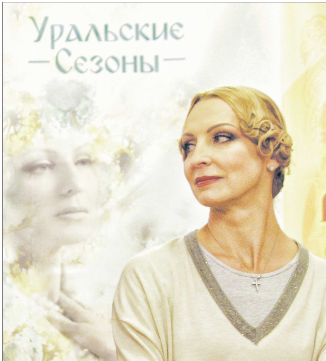
«Уральские сезоны», творческая лаборатория танцевальных коллективов Большого Урала, – совместный проект Благотворительного фонда Илзе Лиэпа и Свердловской детской филармонии. Поддержан губернатором Свердловской области

– «Развлекение»? Не бойтесь называть это слово. Ионанн Кронштадский , например, вообще считал танец божеским искусством, которое отвлекает человека от истинных смыслов жизни. Коверкает душу. И у меня возник вопрос относительно профессии – надо ли заниматься танцем? Искала человека, у кого можно было бы спросить совета. Нашла духовника (он и остаётся со мной), который объяснял: это твой путь. Но моя жизнь ведь интересно развивалась вне Большого театра. Нет, я была солисткой Большого, но всё, что я делала интересного, творчески прорывного – это был мой