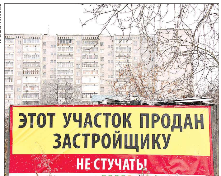
Застройщики постепенно скупают участки земли вокруг будущего городка ЭКСПО