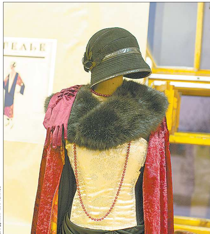
Судебные приставы часто арестовывают манекены вместе с одеждой

КАРТИНА МАСЛОМ. С молотка уходят не только домашние вещи, но и произведения искусства, антиквариат и другие художественные ценности. Довольно часто у должников изымают картины, мебель XIX века и старинные иконы. Так, в феврале этого года в Чкаловском районе Екатеринбурга судебные приставы наложили арест на целый список предметов домашнего интерьера, среди ко-