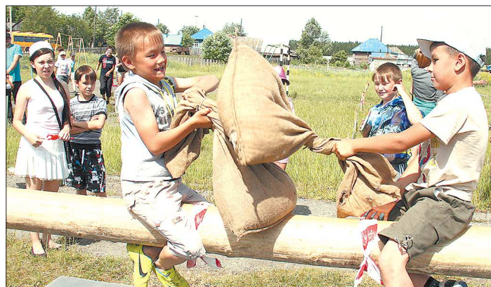
Ежегодно на Среднем Урале проходит праздник детский Сабантуй, чтобы заинтересовать детей народными татарскими традициями