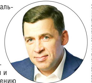
ДЕПАРТАМЕНТ ИНФОРМАТИКИ СО

Губернатор Свердловской области Евгений КУЙВАШЕВ