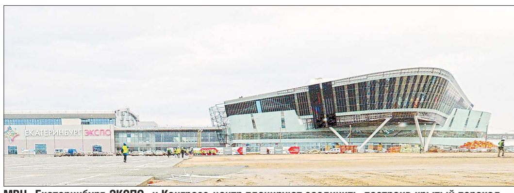
МВЦ «Екатеринбург-ЭКСПО» и Конгресс-центр планируют соединить, построив крытый переход