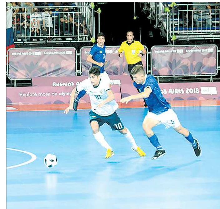
Бразильцам сборная России сумела забить всего один гол

Впереди у сборной России две важные встречи, итог которых и решит дальнейшую судьбу команды. 11 октября наши парни сыгра-