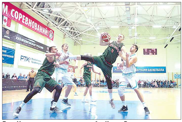
Для «Уралмаша» игра против клуба «Купол-Родники» стала дебютной в Суперлиге-1