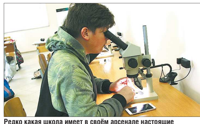
Редко какая школа имеет в своём арсенале настоящие цифровые микроскопы. В Детском университете школьников обучают работать и с этой современной техникой