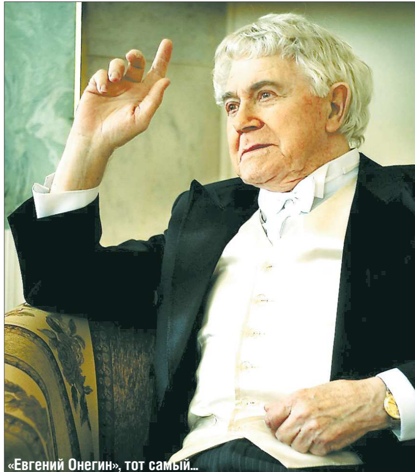
За без малого семь десятилетий сыграно более 200 ролей. Каждая — ещё одна прожитая жизнь. Судьбы. Тексты. Слова, слова... У Гаврилова, кстати, до сих пор потрясающая память