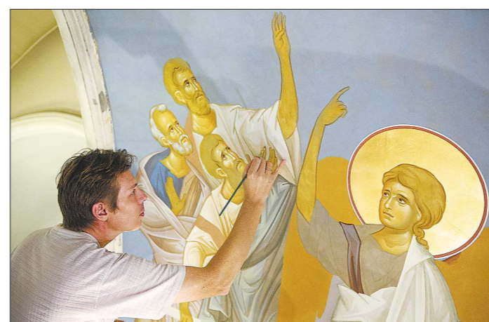
Идёт работа над одним из библейских сюжетов из жизни Иисуса Христа

Своды и стены храма украсят сцены из Евангелия. Центральным изображением станет Христос-Вседержитель, а ниже будут изображены уральские святые, в том числе Симеон Верхотурский и Царственные Страстотерпцы Николай II со своей семьей. Росписи выполнят в русском стиле. Работать над ними в течение года будут пятнадцать иконописцев из Москвы, Тобольска, Челябинска и других городов. Как рассказал руководитель иконописной артели имени Андрея Рублёва Дио-