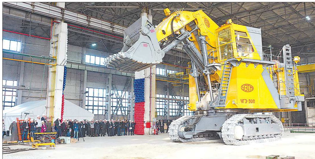
Масса экскаватора УГЭ-300 - 300 тонн, объём ковша - 16 кубических метров

На Уралмашзаводе завершили испытания гидравлического экскаватора УГЭ-300. Вчера на предприятии состоялась презентация машины высотой почти с трёхэтажный дом, которая совсем скоро отправится - на угледобывающий разрез «Шестаки» в Кемеровскую область.