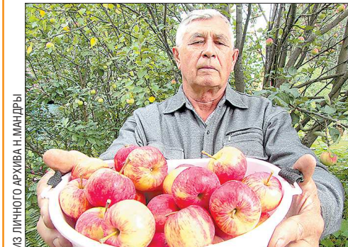
Название сорта яблок садовод уже не помнит, но вкус у них отменный