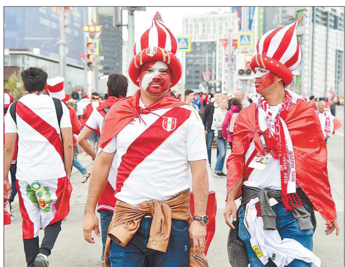
Болельщики из Перу приезжали в Екатеринбург на матч их сборной против французов

И действительно, лучшим игроком года по версии ФИФА стал капитан сборной Хорватии Лука Модрич . Полузащитник провёл феноменальный сезон: выиграл Лигу чемпионов с мадридским «Реалом», вытеснил свою сборную в финал ЧМ-2018 и стал лучшим игроком турнира. Да что говорить, Лука действительно был лучшим в этом сезоне. Но дело здесь в