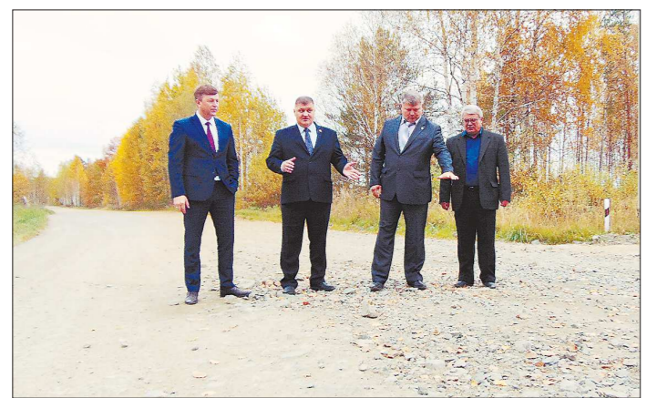
Участники объезда устроили мини-совещание на самом проблемном участке балакинской дороги

Поправки в областные законы о сохранении льгот на переходный период совершенствования пенсионной системы вступят в силу 1 января 2019 года.