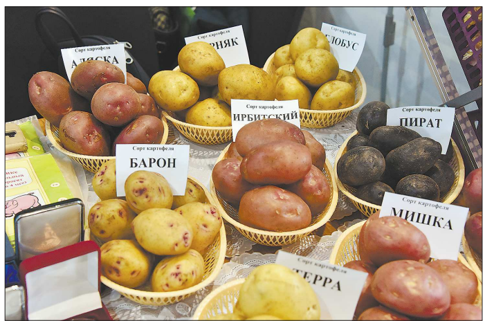
Сорта картофеля, выведенные в Екатеринбурге, известны далеко за пределами Свердловской области