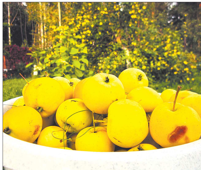
При правильном уходе яблоня каждое лето будет радовать урожаем