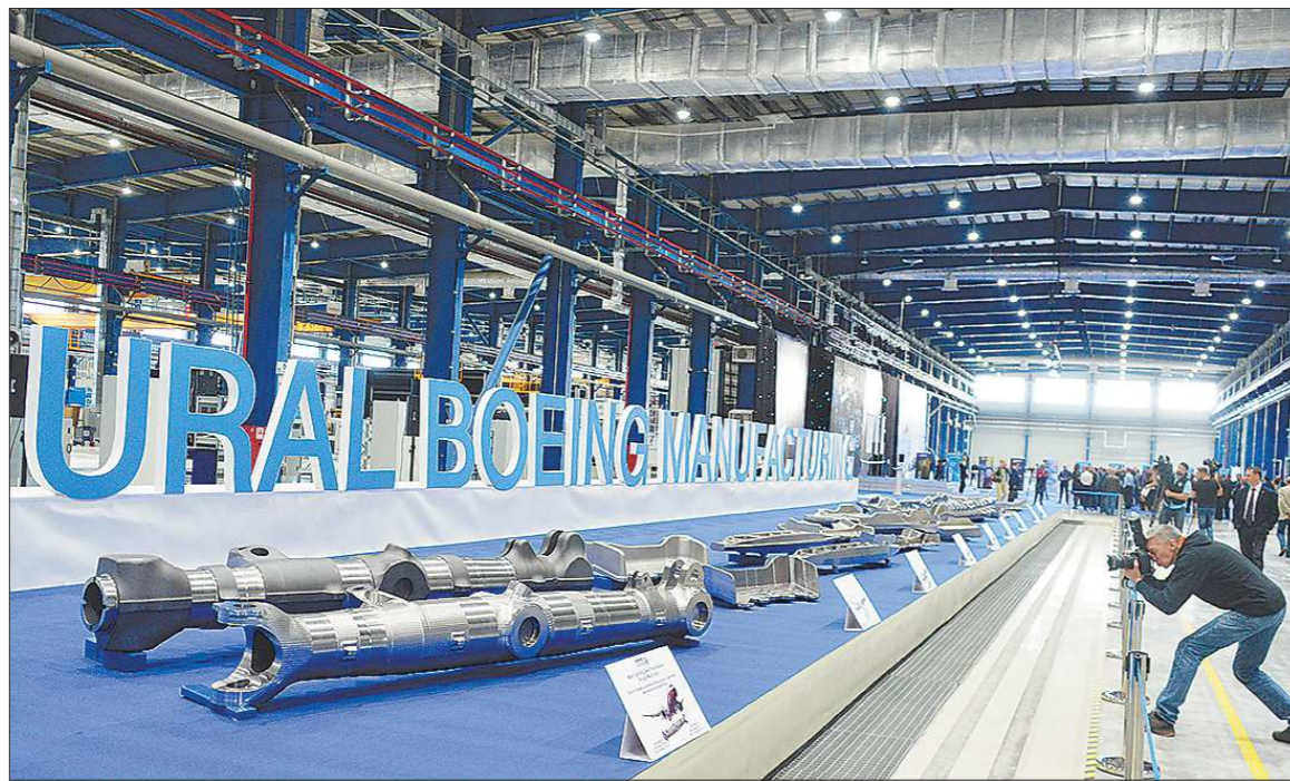
Новый завод будет выпускать высокотехнологичные титановые детали для новейших «Боингов»

Новый завод, появление которого, надо заметить, значительно преобразило в лучшую сторону ландшафт ОЭЗ, включает в себя производственный корпус, оснащенный самым современным станочным парком, и просторное административное здание с необходимой инженерной инфраструктурой.