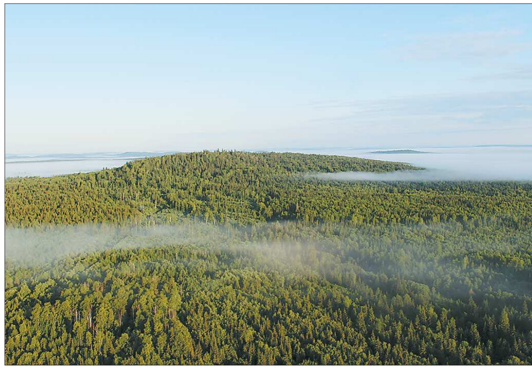
Чтобы стать строевым лесом, сосне нужно расти 70–80 лет

– Да, вся эта система есть. Вырубку у нас двадцать две с половиной тысячи гектаров в год, а леса мы садим почти 23 с половиной тысячи гектаров, то есть с запасом. Порядка 5 100 гектаров лесных культур мы сажаем на вырубных площадях, 1 500 гектаров – это комбинированное лесовозобновление, то есть наполовину сохраняем и сажаем культуры на одной и той же лесосеке, и примерно 17 000 гектаров – это естественное лесовозобновление, где мы сохраняем подрост. Но и тут есть ложка дёгтя. Вроде бы всё это хорошо, но, к сожалению, у нас не хватает сил, техники на уход за лесными культурами. На мой взгляд, надо больше делать рубок ухода в молодняках: рубить, например, осину, а на её место сажать ель. Но у нас это делается только на 50–60 процентов от положенного норматива. Я вообще считаю, что лучше сделать рубки ухо-