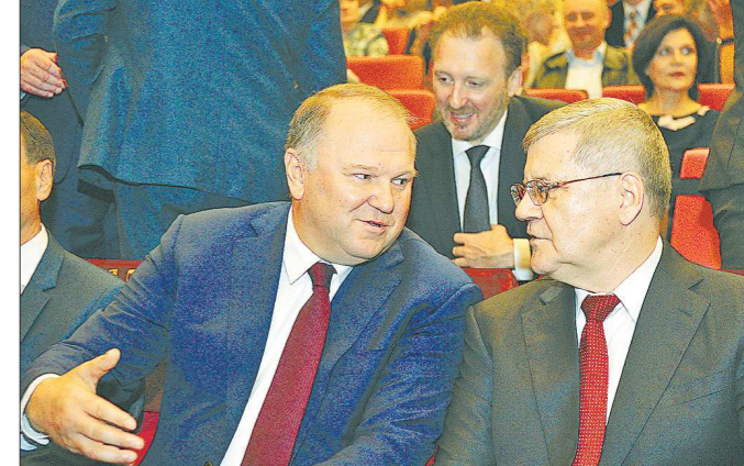
Полномочный представитель Президента России в УрФО Николай Цуканов (слева) и Генпрокурор РФ Юрий Чайка