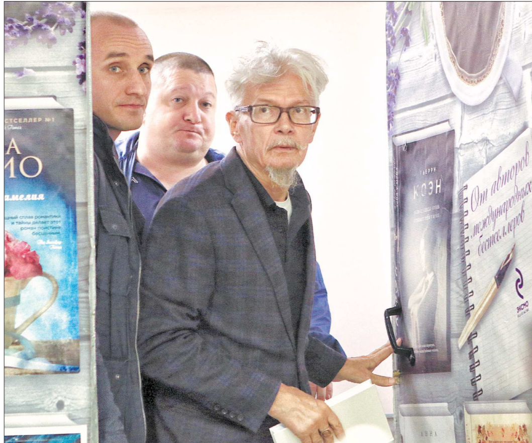
Эдуарда Лимонова всюду сопровождали два охранника. Даже во время встречи с читателями они находились рядом с ним

– «Свежеотбывшие на тот свет» – это уже четвёртая ваша книга, где вы рассказываете об умерших людях, с которыми были знакомы.