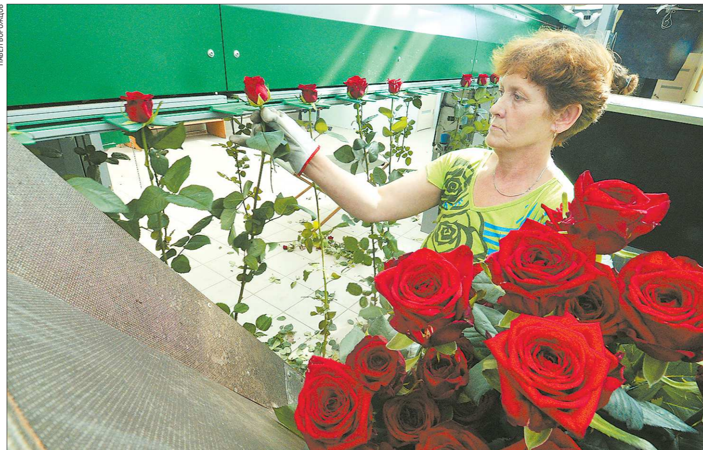
На конвейерную ленту цветоводы «Долины роз» отправляют только лучшие экземпляры

Село Арамашево Алапаевского района нашло неожиданный способ зарабатывать для собственного развития