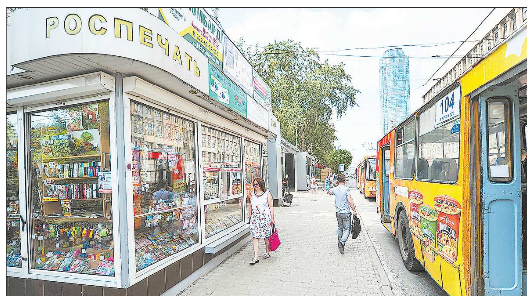
Если сейчас не отстоять каждый газетный киоск в Орджоникидзевском районе, есть опасность потерять их во всём Екатеринбурге

оказались в зоне строительства трамвайной линии в Верхнюю Пышму, другие — установлены с нарушением Правил благоустройства Екатеринбурга, к третьим — есть претензии у сотрудников ГИБДД, то есть попали в зону «треугольника видимости». А большинство — 15 киосков «Распечать» в Орджоникидзевском районе — ликвидируются из-за того, что находятся в охранной зоне тепловых сетей Екатеринбургской теплосетевой компании (ЕТК). Десятки лет никакие киоски теплосетям не мешали, и вдруг вызвали опасность?