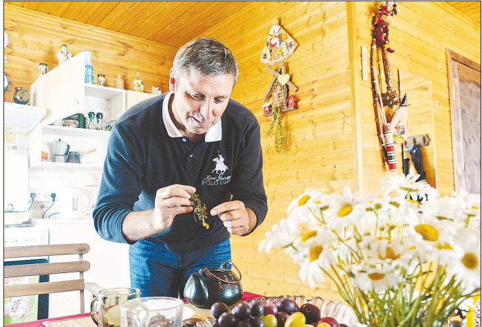
Владимир Чеберяк часто заваривает травяной чай из таволги, зверобоя и кипрея

На дачу в посёлок Атиг, за 90 километров от Екатеринбурга, тенор Екатеринбургского театра оперы и балета Владимир Чеберяк ездит в любое свободное время. Здесь заслуженный артист России отдыхает от шума, городской суеты и черпает вдохновение, поэтому его участок обычно посещают только родные и близкие. Но для «Областеты» Владимир сделал исключение.