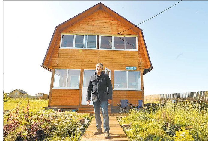
Двухэтажный дом был построен год назад, в планах у хозяина - завершить внешнюю отделку