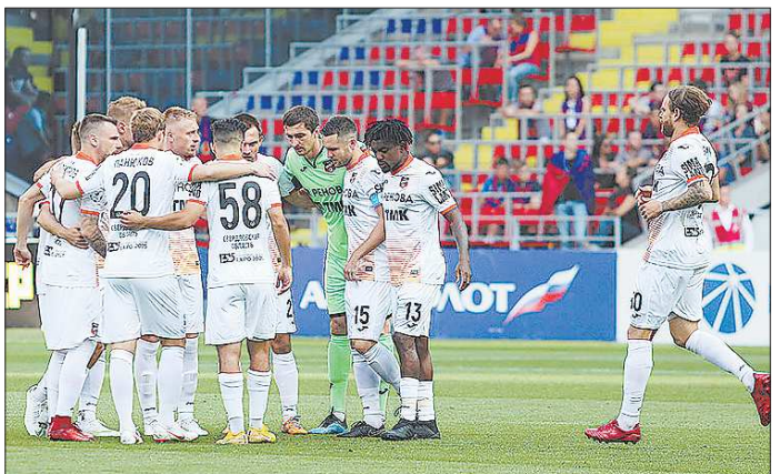
После шести туров «Урал» находится в зоне вылета

В первых играх сетовали на невезение: весь матч давить «Анжи», который еле наскрб денег на поездку в Екатеринбург, и в итоге уступить 0:1 в матче-открытии чемпионата. Что это, если не невезение?