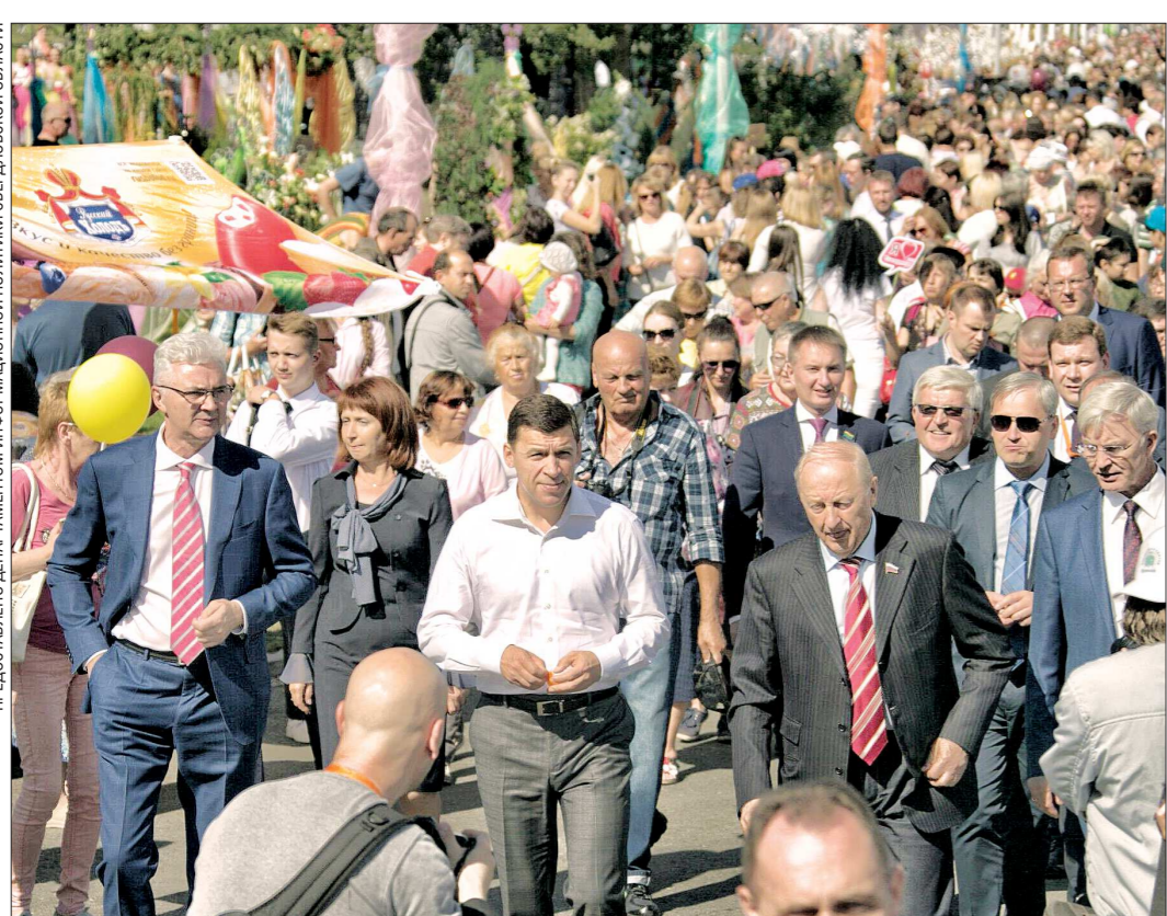
«Следующий этап взрывоподобного роста наступил, как ни парадоксально, в середине сложных 90-х годов, когда стараниями губернатора Эдуарда Росселя город открылся миру»