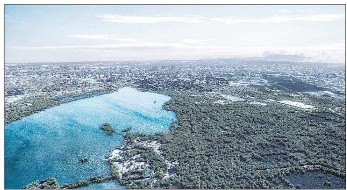
«Участок земли общей площадью 555 гектаров (в том числе: под выставочную зону – 184 гектара, прибрежную рекреационную зону – 18,6 гектара, бульвары и парки – 75 гектаров) зарезервирован для государственных нужд постановлением правительства Свердловской области»