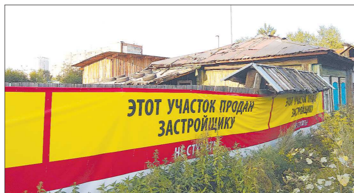
Несмотря на то, что решение о проведении ЭКСПО-2025 в Екатеринбурге ещё не принято, застройщики постепенно выкупают земельные участки неподалёку от места проведения выставки

Рядом с будущим городком ЭКСПО-2025 сейчас строятся сразу несколько крупных объектов, концепции и проекты которых защищались на заседаниях городского градсовета последние два года. Уже в конце этого года должны сдать первую очередь жилого комплекса «Ягтарная долина», который расположится в районе улиц Татищева – Лощмановых