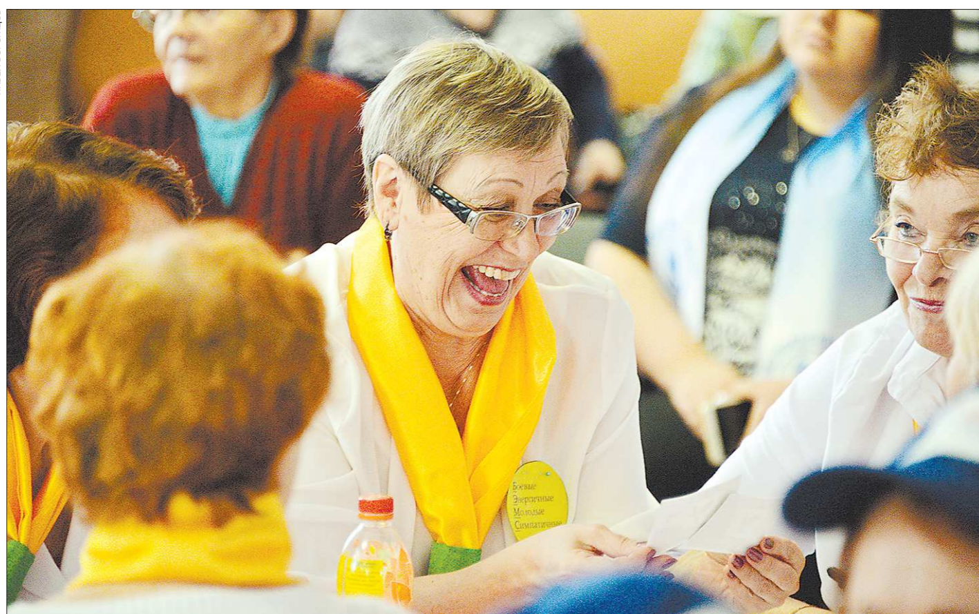
Жизнь на пенсии может быть насыщенной, яркой и интересной. Так считают участники интеллектуальных баттлов, которые регулярно проходят в Екатеринбурге. На фото – команда Чкаловского района «БЭМС: боевые, энергичные, молодые, симпатичные»

Завтра в Свердловской области стартует месячник мероприятий на поддержку ветеранов, организацию их досуга, решение актуальных задач. В это время в городах и селах региона проводятся социальные акции, культурно-развлекательные и спортивные мероприятия. К месячнику активно подключаются магазины и предприятия бытового обслуживания.