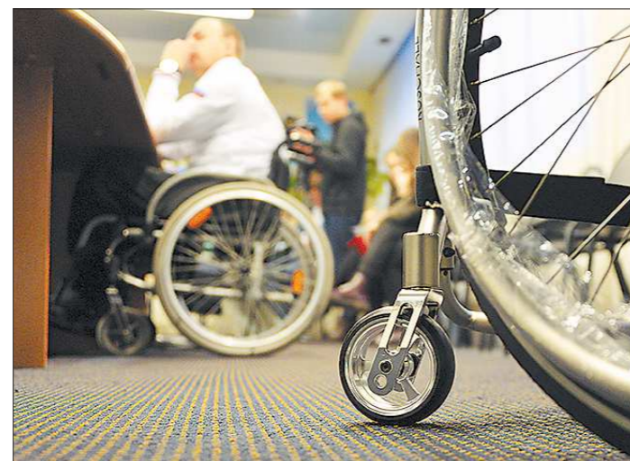
Ресурсный центр, в частности, упростит и ускорит процесс получения инвалидами необходимых технических средств реабилитации

Работа центра будет построена на межведомственном взаимодействии. На одной площадке, пообщавшись с представителями разных служб, человек сможет узнать о мерах социальной поддержки людей с ограниченными возможностями здоровья, проконсульти-