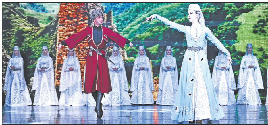
– Где черпаете кадры для ансамбля?

– Всё нашим предкам давалось непросто, всё приходилось добывать через трудности. Поэтому и характер у нас такой, что со стороны кажется жёстким и даже неприемлемым. Но даже люди с жёстким характером, как видите, тоже любят танцы. Танец – это наша жизнь. Мы до сих пор слышим от старших, что когда нашему народу приходилось преодолевать трудности, когда была какая-то угроза, даже тогда танцевали. Я думаю, что они так преодолевали внутренний страх. Конечно, на танец накладываются те условия, в которых мы живём. Жителю гор постоянно приходится преодолевать какие-то препятствия – надо взобраться на скалу или преодолеть речку... Отсюда и множество характерных ломаных движений.