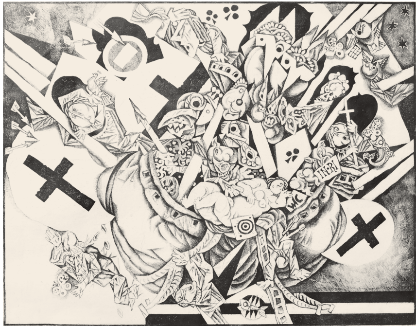
Волович В.М. «Гротески. Корабль дураков». 2011. Репродукция сделана на выставке «Корабли, дураки, женщины и монстры» (2 марта 2017), ЕГСИ

Резюме (опять же со слов В.М.): «Как художник я почти не изменялся, но постоянно изменялись обстоятельства художественной жизни. В системе соцреализма я считался формалистом. Во всяком случае, имел в связи с этим определённые неприятности. Затем, никак не изменившись, я перешёл в разряд постмодернистов. А заканчиваю свою творческую жизнь, опять же несколько не изменившись, чуть ли не хранителем реалистических традиций и ретроградом».