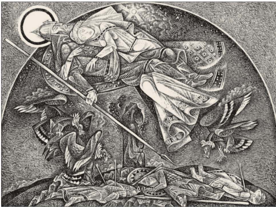
Волович В.М. Плач Ярославны. Из иллюстраций к книге «Слово о полку Игореве». 1982. Бумага, офорт, лак мягкий. 52,6х72,4. В собрании Екатеринбургского музея изобразительных искусств