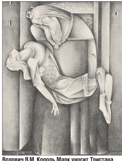
Волович В.М. Король Марк уносит Тристана к берегу моря. Из серии иллюстраций к роману Ж. Бёде «Роман о Тристане и Изольде». 1972. Бумага, автолитография. В собрании Екатеринбургского музея изобразительных искусств