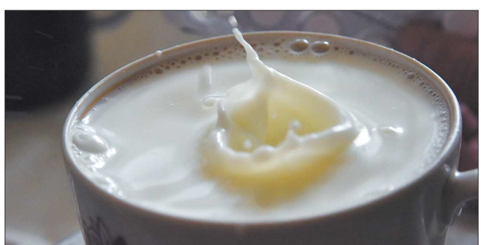
За первые шесть месяцев этого года на Среднем Урале произведено 312,9 тысячи тонн молока

Но важно, чтобы то позитивное настроение и то ожидание перемен, которые охватили Екатеринбург и всю страну после чемпионата, не исчезли, а только крепки. Это