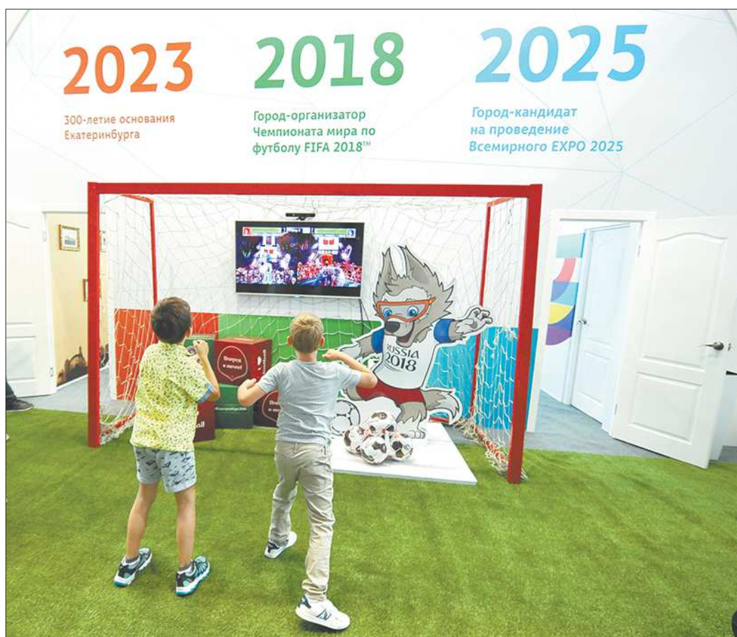
Чемпионат мира по футболу-2018 проверил на прочность желание уральцев принять и достойно провести международное мероприятие

Сейчас основные усилия сосредоточены на международном лоббировании заявки. Переговоры ведутся на всех уровнях: в них участвуют уже не только руководители области, города и заявочного комитета, но и члены правительства страны, в поездках за рубежом к российским делегатам присоединяются наши дипломаты в этих странах.