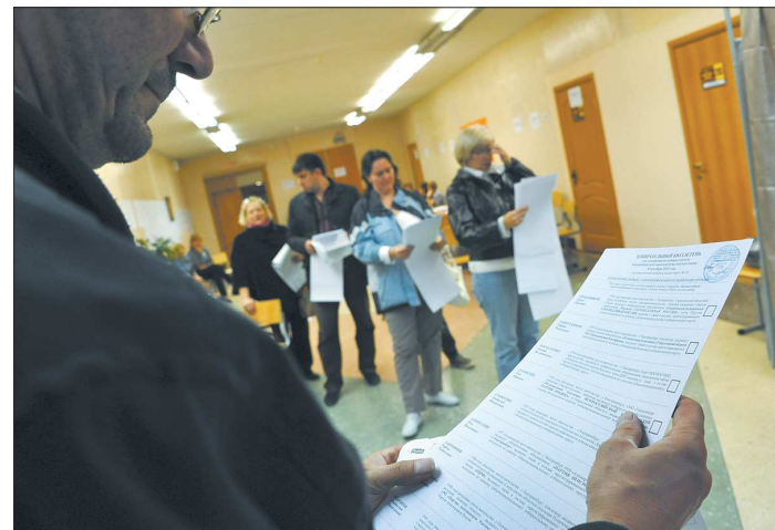
Таким был список кандидатов в гордуму Екатеринбурга в 2013 году. Нынче количество претендентов заметно сократилось

Число партий, которые планировали участвовать в выборах, также за пять лет сократилось - с 27 до восьми. Вы помните, в 2013 году был длинный бюллетень и список из 23 партий. Сейчас в списке будет только 7 партий - это те избирательные объединения, которые имеют право представлять свои списки без сбора подписей. Кроме них, на выборы заявлялись «Коммунисты России», но им было отказано в регистрации на основании недостаточного количества действительных подписей - они должны были собрать от 5 416 до 5 957 подписей, но, к сожалению, им это сделать не удалось, - отметил Валерий Чайников.