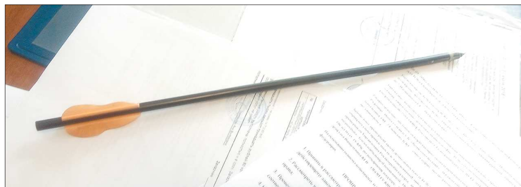
Эта стрела пробила окно и металлические жалюзи в офисе ТСЖ на улице Высоцкого