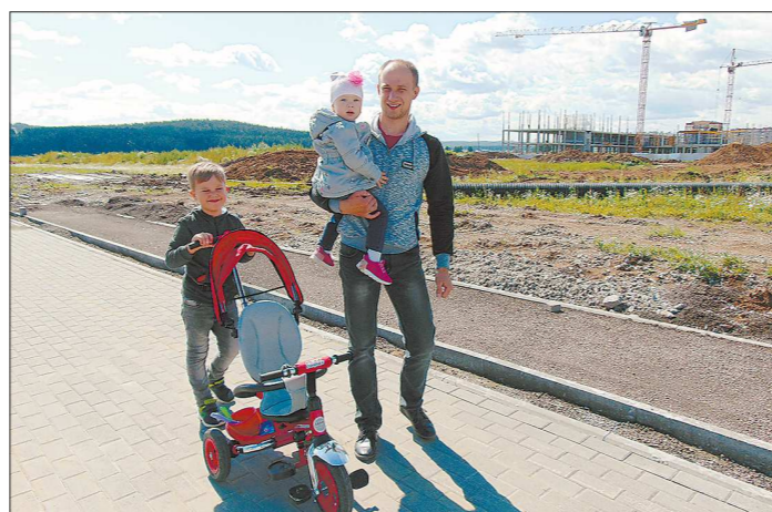
Проходя мимо строящейся школы, жители микрорайона всегда показывают её детям: «Вот здесь вы будете учиться»

нии, посвящённом Дню города, речь шла о достижениях промышленной столицы Урала и её перспективах. И это не просто комплименты к празднику,