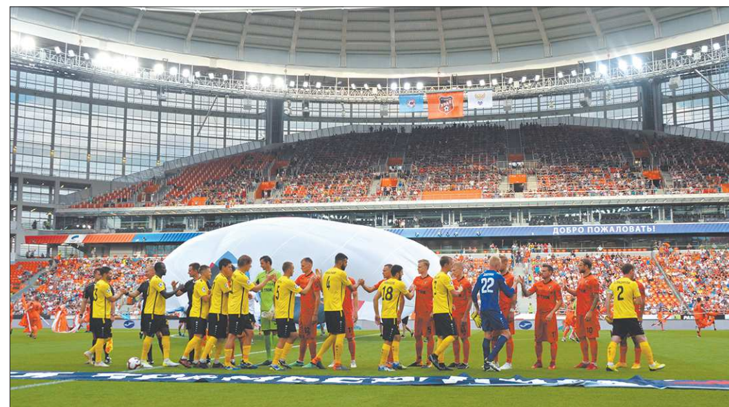
Если на поле будет красивый футбол, трибуны наверняка ответят аншлагом

Вы скажете, что сравнение некорректно, поскольку деньги на поездку в Россию многие иностранные болельщики копили несколько лет.