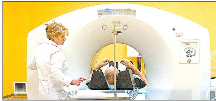
«ПЭТ-Технолоджи» уже оказывает уральцам схожие медуслуги