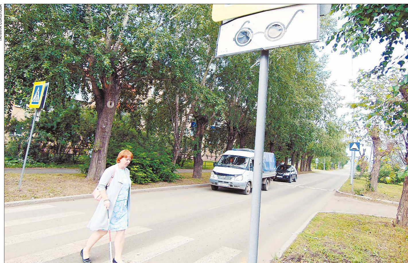
По правилам дорожного движения (пункт 14.5 ПДД) водители на перекрёстке обязаны считать взмах специальной трости в руках пешехода красным сигналом светофора

Во многих городах Свердловской области, в Екатеринбурге, Ревде, Реже - там, где работают предприятия ВОС - Всероссийского общества слепых, существуют жилые комплексы, где проживают инвалиды по зрению. Большинство людей с обычным зрением даже не подозревают о их существовании. На восточной окраине Нижнего Тагила тоже есть такой комплекс. В народе его называют «слепым кварталом». Его жизнь всегда была обособленной, но недавно проблемы незрячих тагильчан увидели власти