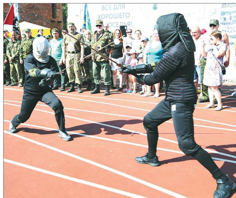
Спортивные состязания – непременный атрибут любого военного праздника, но фехтование на двуручных мечах и для них – экзотика...

На протяжении двух дней на территории палаточного лагеря работали пло-