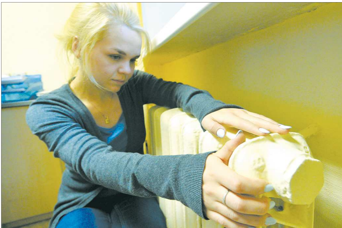
Горячая вода в квартиры многих жителей Кушвы поступает только с началом отопительного сезона. Желающим пользоваться такой услугой летом предлагают согласиться с одновременным нагревом радиаторов отопления в их жилищах...

А как же жители? Побузили первое время, собираясь под красными флагами в центре города. Потом от митингов перешли к активным действиям: закупили электроды, установили газовые колонки. Даже нашли положительные моменты в отмене коммунальной ус-