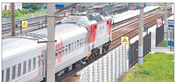
Для РЖД проектируют новые пассажирские вагоны