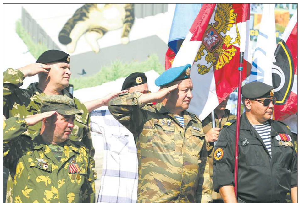
Фестиваль собрал ветеранов не только десанта, но и морской пехоты, военной разведки, внутренних, пограничных и всех прочих войск – участников войн и военных конфликтов