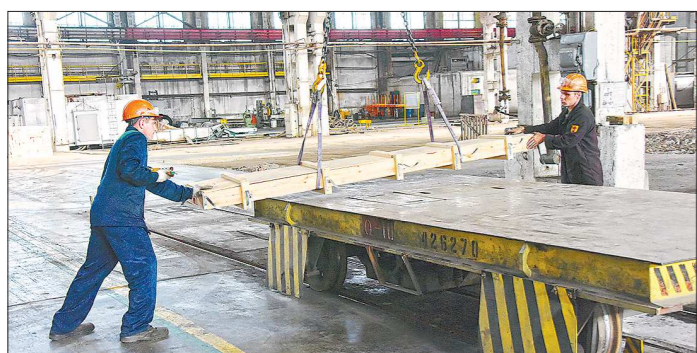
Одним из флагманов роста экономики Свердловской области в первом полугодии этого года стала металлургия

А вообще, усилиями активистов партийного проекта мы надеемся повысить уровень безопасности дорожного движения и качество работы дорожной отрасли в целом.