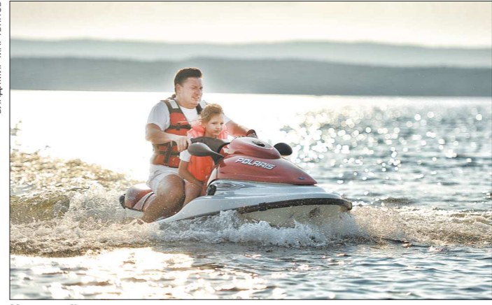
На водоемах можно не только искупаться, но и покататься на гидроциклах или порыбачить. Озеро Таватуй

Популярное место отдыха расположено на окраине микрорайона Эльмаш на месте быв-