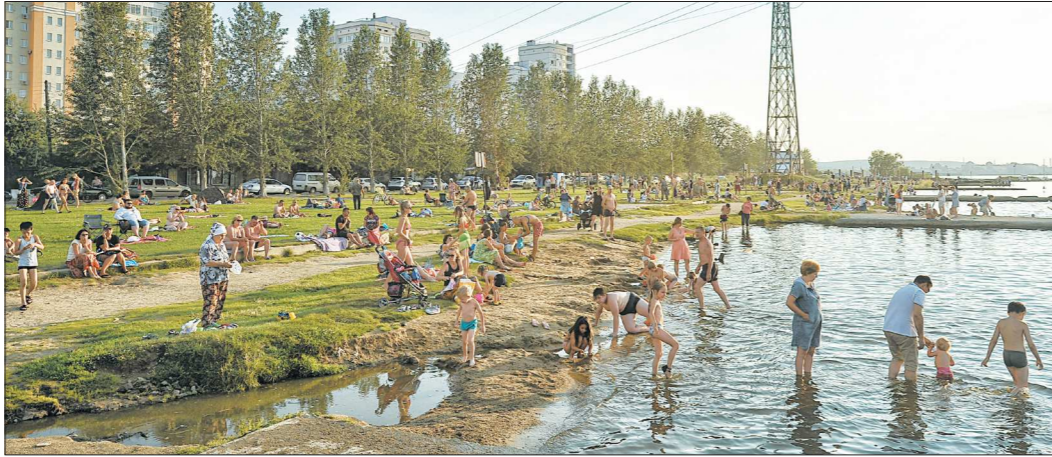
Жители Екатеринбурга едут на пляжи после окончания рабочего дня. Верх-Исетский пруд

Водоем находится в 50 километрах к северо-западу от Екатеринбурга на фоне живописных гор и лесов. Почти всё озеро окружено базами отдыха и детскими лагерями, а пляжи есть сразу на двух берегах. Популярным местом отдыха его делает расположение, ведь добраться сюда очень просто: на правую сторону можно доехать на машине или автобусе №147. Вдоль левого берега курсируют электрички до Нижнего Та-