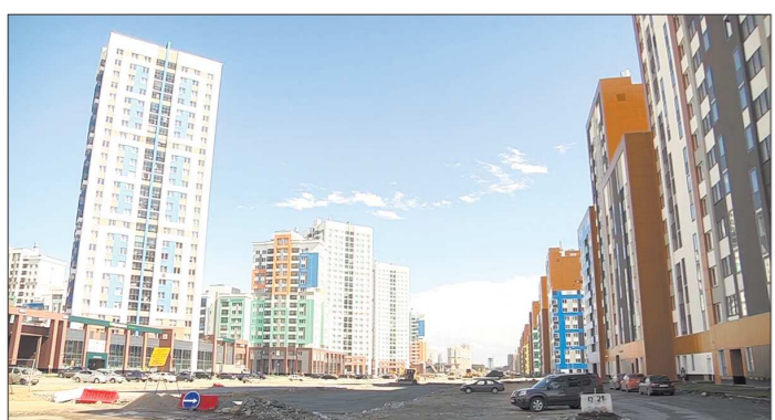
Академический - комфортный и внешне симпатичный район, но транспортные преобразования ему не помешают