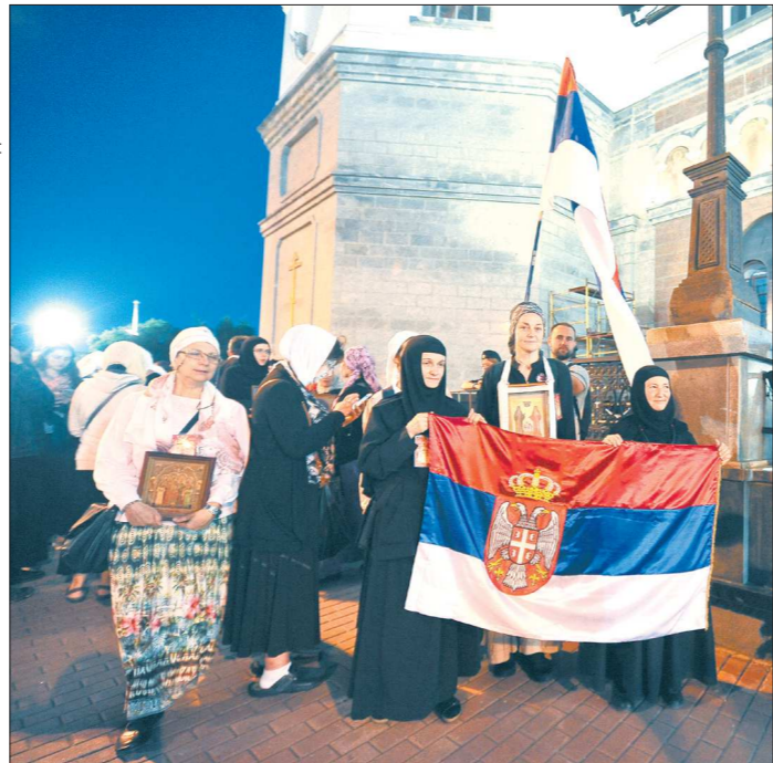
Группу паломников из Сербии, которые растянули национальные флаги у патриаршего подворья и пели песни о любви к России, с первого взгляда вполне можно принять за футбольных болельщиков (разве что мелодию у крестоносцев лиричнее). По их словам, православие исторически объединяет наши народы