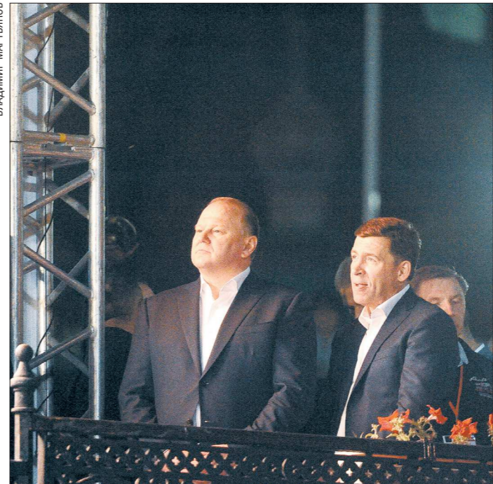
Полномочный представитель Президента РФ в УрФО Николай Цуканов и губернатор Свердловской области Евгений Куйвашев во время Божественной литургии перед ночным крестным ходом. До Ганиной Ямы они шли вместе