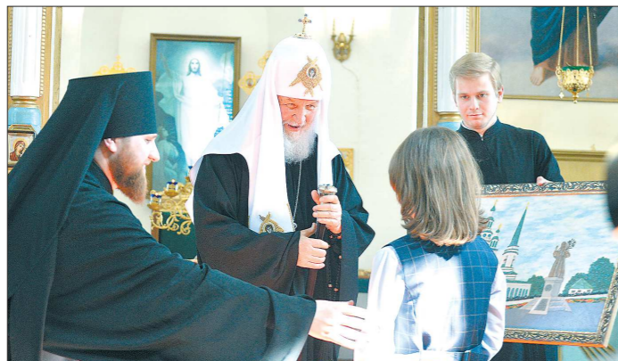
В Свято-Троицком соборе патриарху подарили картину с изображением храмовой площади собора

В минувшую субботу Святейший Патриарх Московский и всея Руси Кирилл провёл в Екатеринбурге историческое заседание Священного синода. Впервые высший орган управления Русской православной церкви собрался в уральской столице. На следующий день предстоятель РПЦ отправился в Алапаевск — город, где великая княгиня Елизавета Фёдоровна и другие члены императорского дома провели в заточении свои последние дни.