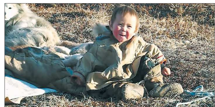
Ненцы Ямала считают, что дети поддерживают гармонию на ограниченном пространстве чума...

Гран-при фестиваля «Этно Кино» удостоен Альберт Самойлов (Дальневосточная киностудия) – создатель картины