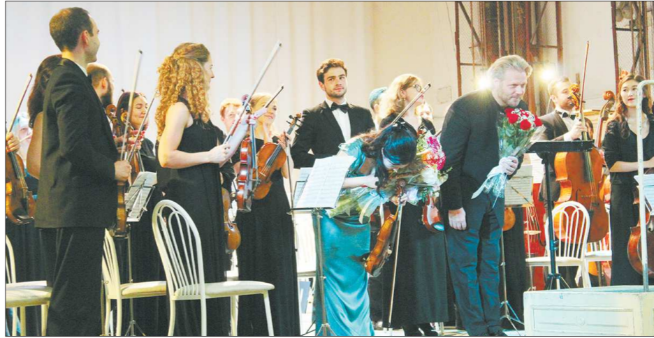
Иностранцы музыканты Чайковский-оркестра были очень тронуты таким трепетным приёмом красноуральцев и гостей города

А чтобы открытие нового зала действительно надолго запомнилось публике, выступить в Красноуральске пригласили участников Летней оркестровой академии, которые объединились в Международный молодежный Чайковский оркестр.