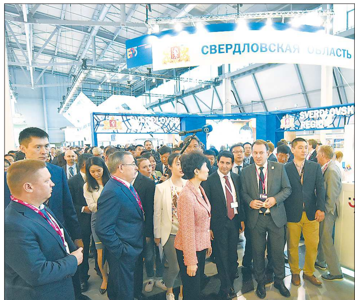
На экспозиции Свердловской области госпоже Гао Янь показали макет ЭКСПО-городка в Екатеринбурге и концепцию умного города и даже пригласили почётную гостью на горнолыжный курорт «Гора «Белая»

Председатель КНР Си Цзиньпин говорил, что регионы являются важной силой развития двухстороннего сотрудничества России и Китая, – заявила заместитель министра коммерции КНР Гао Янь на церемонии открытия Пятого Китайско-Российского ЭКСПО. – Сегодня наши страны переживают мощный экономический подъём, но гло-