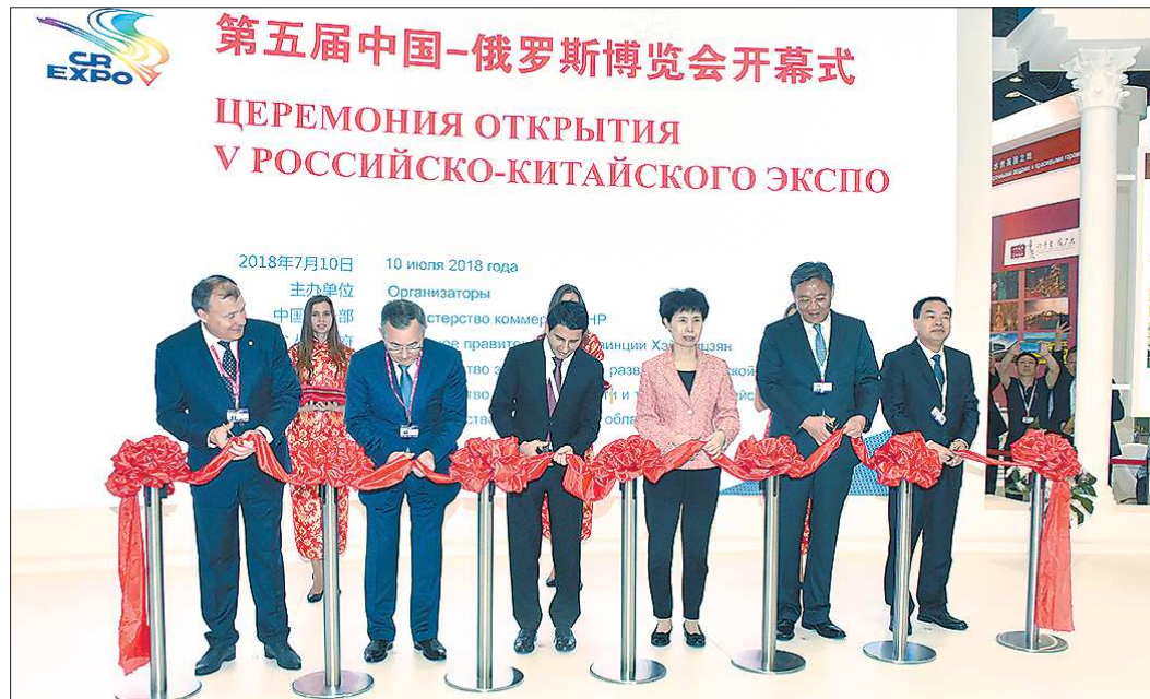
Вчера был торжественно дан старт международной выставке, на которую обе страны возлагают самые амбициозные надежды