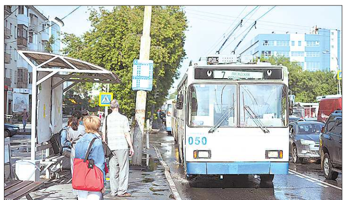
В Екатеринбурге стартовала реформа городского электротранспорта, обещающая сделать трамваи и троллейбусы более умными