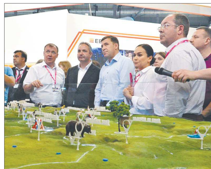
Большее всего посетителей на стенде области привлёк макет проекта туркластера «Гора Белая»

Все проекты разделены на шесть тематических блоков. Например, в блоке «умная мобильность» был продемонстрирован комплекс «Цифровой патруль», который позволяет в режиме онлайн выявлять должни-