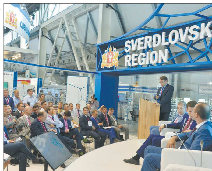
В одном из павильонов стенда области обсудили создание программы «Умный регион»

Однако больше всего посетителей стенда привле-