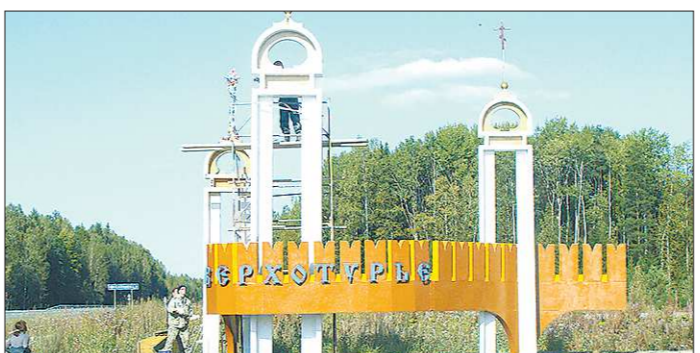
К юбилею Верхотурье ждёт обновление

– Если у жителей возникнут вопросы, им придётся ехать в ваш главный офис в Первоуральске? – Совсем необязательно. Для удобства населения мы открываем в муниципалитетах свои представительства. Люди будут получать полный комплект услуг на местах – от подписания договора и до разрешения какой-то конфликтной ситуации. Все вопросы будут решаться максимум в течение двух дней. Конечно, мы будем принимать жителей в главном офисе в Первоуральске – переулок Школьный, 2. При необходимости готовы организовать выездные встречи в городах и пресс-конференции с местными СМИ.