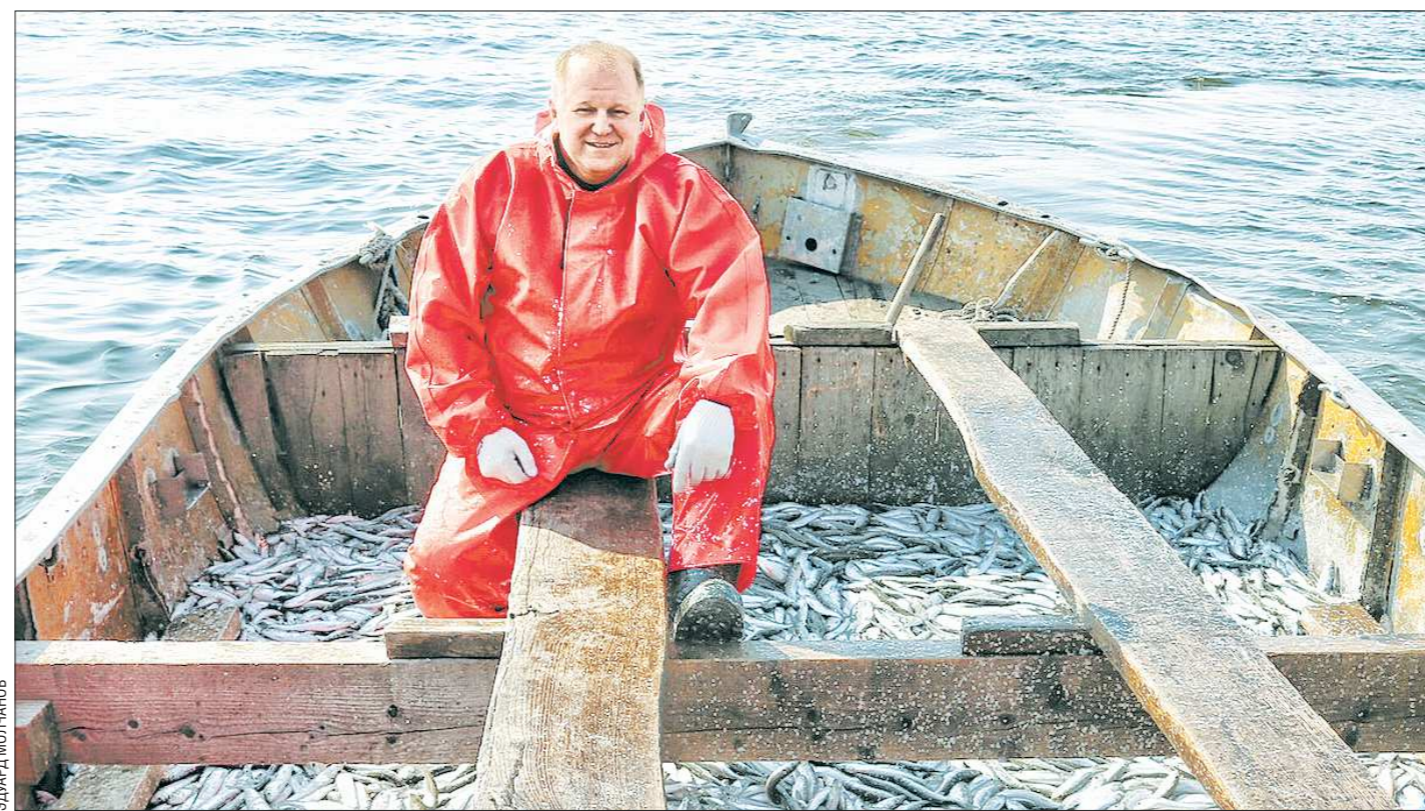
В марте 2015 года Николай Цуканов вышел в Балтийское море на рыболовецком судне колхоза «За Родину», чтобы принять участие в ловле салаки. Вместе с рыбаками он перегружал рыбу из поставленных неводов в лодки для доставки на берег. За тот рейс было добыто 12 тонн салаки

Неизвестные факты о новом полпреде Президента России в УрФО