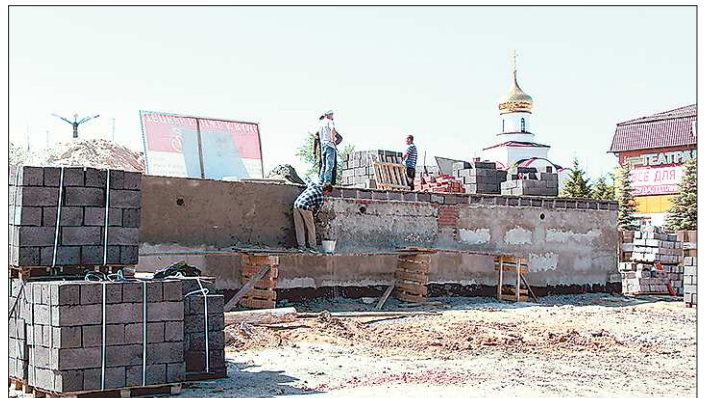
В скором времени артёмовцы получат двухэтажное здание с кассами, залом ожидания, кафе и даже спортзалом