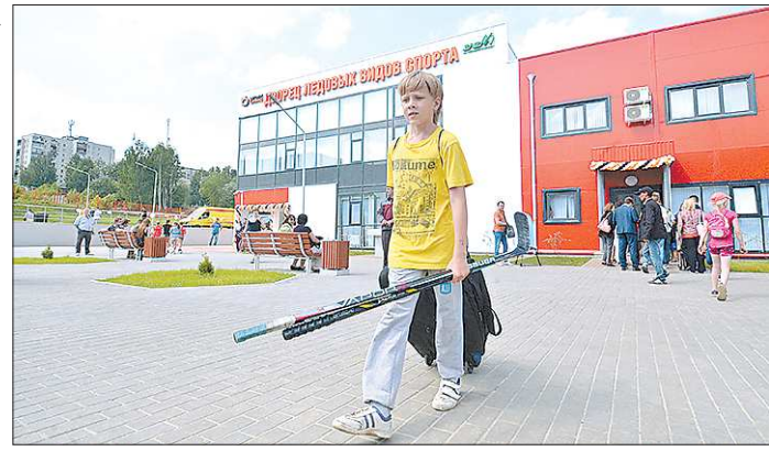
Сейчас в Кировграде откроют как минимум две секции по хоккею