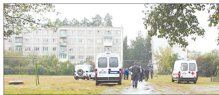
Сейчас в посёлке Малышева работает следственная группа

Неизвестный в чёрной куртке и тёмных очках нанёс ему несколько ударов монтировкой по голове. Покушение произошло рядом с гаражом, куда депутат шёл за машиной. После нападения преступник убежал в сторону леса, по пути выбросив монтировку и портфель с вещами депутата, который он взял, чтобы, возможно, симитировать попытку ограбления. Раненого председателя думы доставили в городскую больницу Асбеста, а позже перевезли в Свердловскую областную больницу № 1, где у него диагностировали перелом лобной кости черепа. Руководитель пресс-