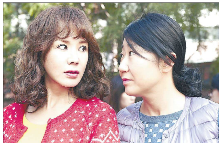
«Мисс жена» - фильм о корейской женщине Ён-у, которая всегда добивалась своего без чьей-либо помощи. Но однажды её жизнь кардинально меняется...