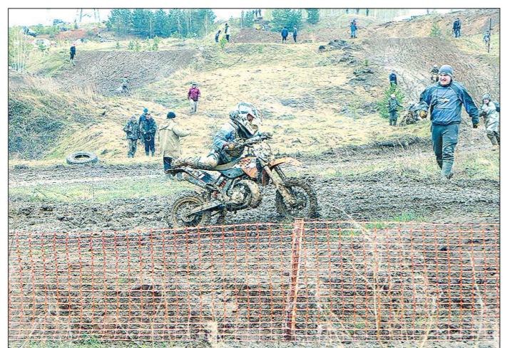
Ребята из Заречного учатся быть мужчинами с детства

История у центра совсем недолгая – лицензию на ведение образовательной деятельности он получил 1 апреля 2016 года, но предшествовала этому долгая кропотливая работа группы энтузиастов. Раньше в Заречном было отделение технических видов спорта в ДЮСШ, созданное по инициативе местного Фонда развития автомото-