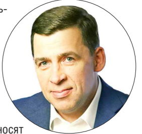
ДЕПАРТАМЕНТ ИНФОРМАТИКИ СО

Губернатор Свердловской области Евгений КУЙВАШЕВ